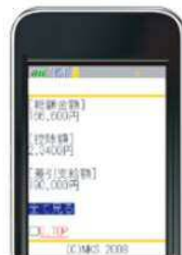
携帯電話による明細閲覧