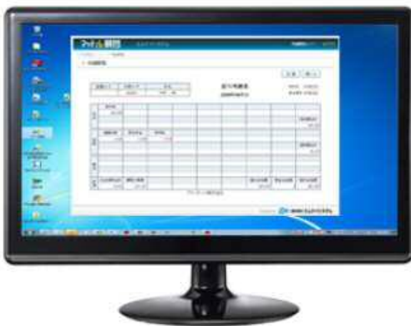
パソコンによる明細閲覧